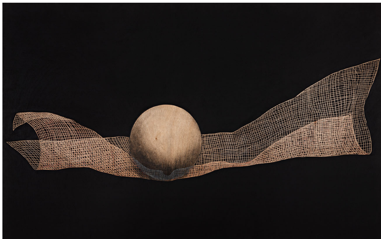
Miguel Rasero · S/T · Acrílico sobre madera · 100x160 cm. · 2001.

ÀMBIT Galeria d'Art tiene el placer de presentar la exposición "Redes", una selección de obras de Miguel Rasero que pertenecen a su "serie negra". La selección muestra una veintena de trabajos que tienen como hilo conductor la red, objeto central de esta serie y elemento simbólico privilegiado en los trabajos del artista.