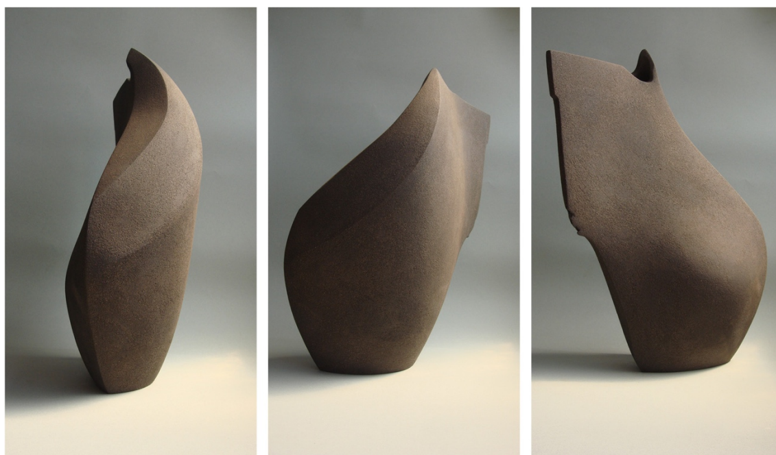
Negro B Refractari negre 56 cm x 37 cm x 16 cm © Sophie-Elizabeth Thompson

Inauguració: Dijous 18 de maig a dos quarts de vuit del vespre